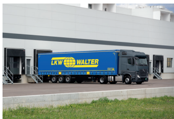
... logisztikai célokra