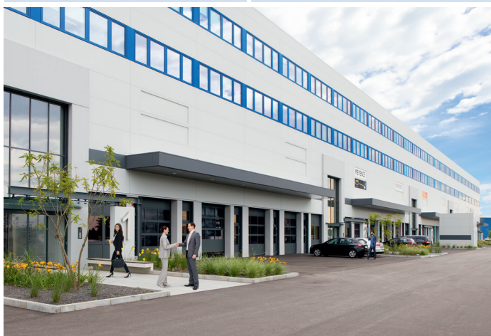
... kereskedelmi és ipari célokra