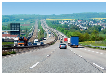
... tökéletes infrastruktúrával